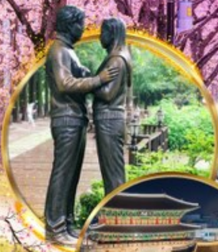
ป้อมฮวาซอง