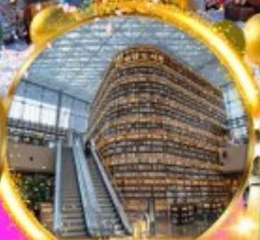
ห้องสมุด Coex mall