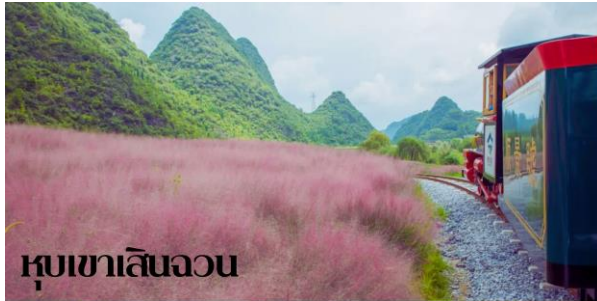
หุบเขาเสินฉวน

๑๐|บริการอาหารเช้า ณ ห้องอาหารของโรงแรม(1)