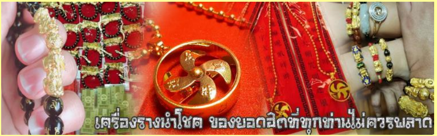
เครื่องรางนำโชค ของยอดฮิตที่ทุกท่านไม่ควรพลาด