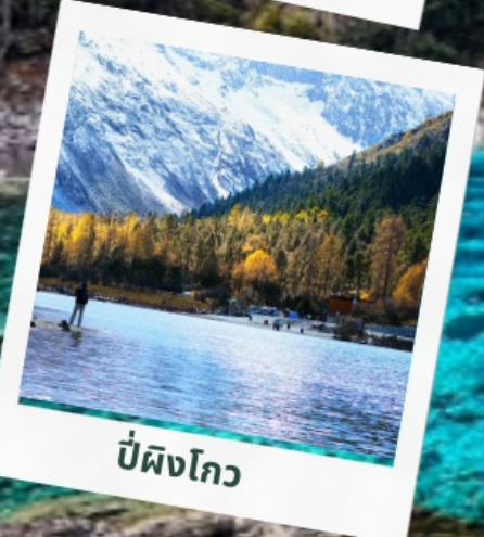
ปี่ผิงโกว