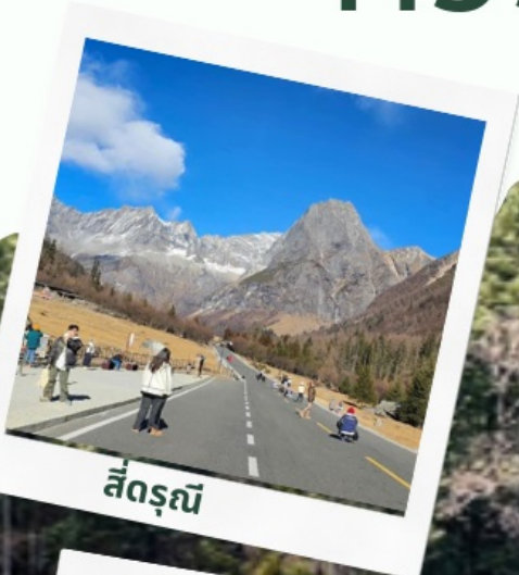
สี่ดรุณี