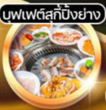
บุฟเฟ่ต์สุกัป้งย่าง