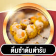
ติ่มซำคั่นตำรับ