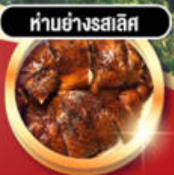
हांอย่างรสเลิศ