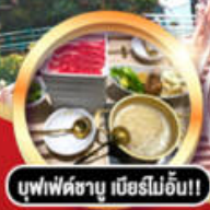
บุฟเฟ่ต์ชาบู เนิอร์ไม่อื่น!!