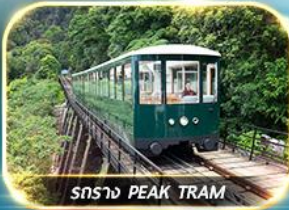
รถราง PEAK TRAM