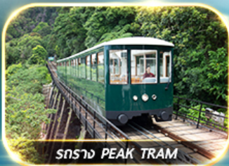
รถราง PEAK TRAM