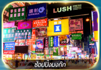
ช้อปปิ้งมอลล์

เต็มอิ่มทั้งบุญ และ ช้อปปิ้งแบบจัดเต็ม จิมซาจู้ย มงก๊ก