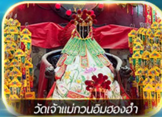
วัดเจ้าแม่ทวนอิมสองอ่า