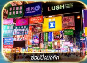
ช้อปปิ้งมงก๊ก

เต็มอิ่มทั้งบุญ และ ช้อปปิ้งแบบจัดเต็ม จิมซาจุ่ย มงก๊ก