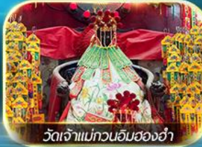
วัดเจ้าแม่กวนอิมสองอ่า