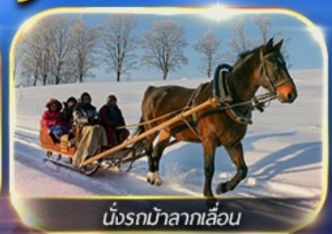
นั่งรถม้าลากเลื่อน

พักหมู่บ้านหิมะ ชมแสงสียามค่ำคืน ฟรีนังรถม้าลากเลื่อน