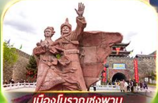
เมืองโบราณซ่งพาน