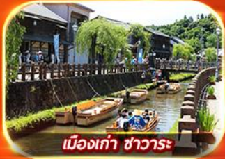
เมืองเก่า ซาวาระ