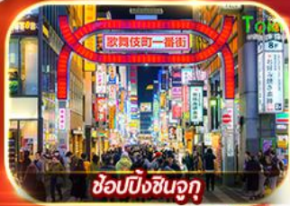
ช้อปปิ้งชินจูกุ

ล่องเรือโจรสลัดทะเลสาบอาชิ เช็คอินวัดอาซากุสะ หมู่บ้านน้ำใสโอยชิโนะฮักโก ซ้อปปิ้งชินจูกุ