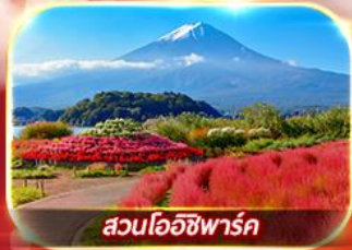
สวนโอยชิฟาร์ม