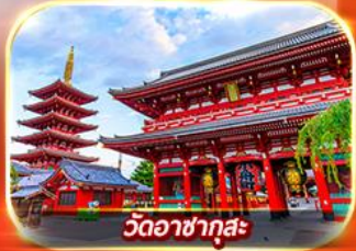
วัดอาซากุสะ