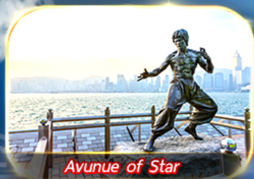
Avunue of Star