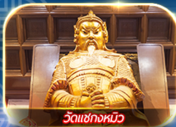
วัดเขากงหมิว