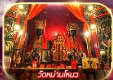
วัดบ้านโหนด