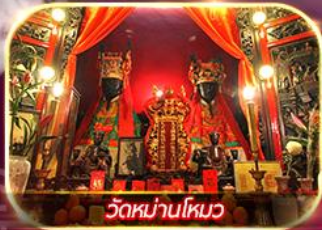
วัดหนานโหมว