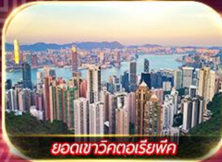
ยอดเขาวิกตอเรียพิค