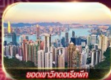
ยอดเขาวัดเกอเล่