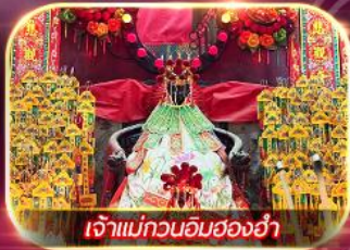
เจ้าแม่กวนอิมของฮำ