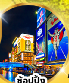
ช้อปปิ้ง ชินไซบาชิ