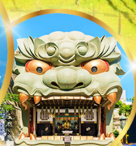
ศาลเจ้า ฟุชิมิ อินาริ