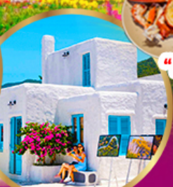
มารีนา คาเฟ่