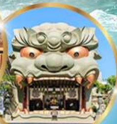
ศาลเจ้านิมะ ยาชากะ