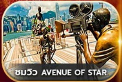
ชมวิว AVENUE OF STAR