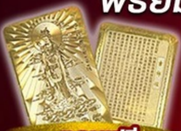
แถมฟรี แผ่นทองเจ้าแม่กวนอิม