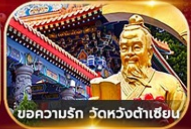
ขอความรัก วัดหวังต้าเซียน