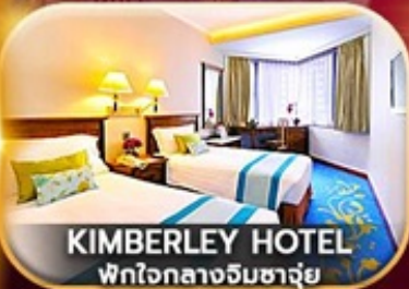
KIMBERLEY HOTEL พักใจกลางอิมฮางยู