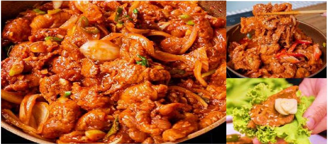
พร้อมข้าวสวยร้อน และเครื่องเคียงต่าง ๆ

กลางวัน ๑๐บริการอาหารกลางวัน ณ ภัตตาคาร เมนู หมูผัดซอสเกาหลี เป็นหนึ่งในเมนูที่รู้จักกันดี ที่ชาวตูดิบชั้นดี หมักในซอสพริกตำรับแท้ของเกาหลี รสชาติเผ็ดนิด หวานหน่อย รับประทานคู่กับข้าวสวยร้อนๆ หรือวางหมulgบนผักสด พร้อมด้วยเครื่องเคียงต่าง ๆ ห่อเป็นคำรับประทานได้ตามใจชอบ