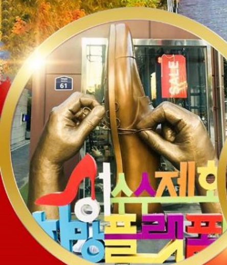
ซองชูดง วอร์ดกั้งสตรีท