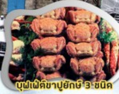
บุฟเฟ่ต์ขาปูยักษ์ 3 ชนิด