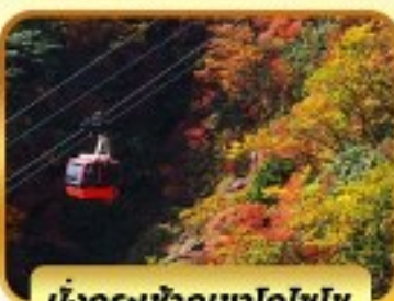
นั่งกระเช้าภูเขาโทโฮโซ