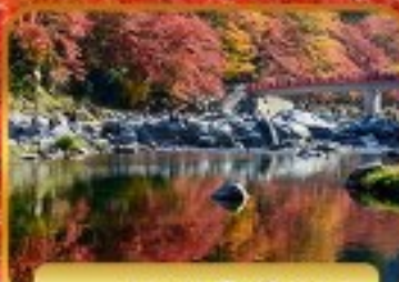
หุบเขาโคริงเค