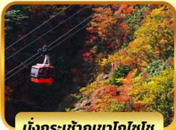
นั่งกระเช้าภูเขาโทโฮโซ