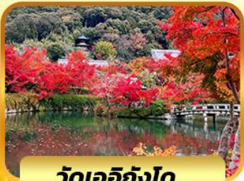
วัดเออิทังโด