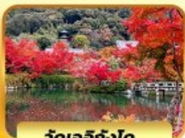
วัดเออิทังโด