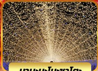
นาบะนะโนะซาโตะ

โอบาระ(ซากุระ) เมืองเกียวโต วัดคิโยมิจิ(วัดน้ำใส) หมู่บ้านชิราคาวาโกะ ถนนซันมาชิซูจิ สะพานนาคาบิชิ ช้อปปิ้ง ซินไซบาชิ ย่านซาคาเอะ อีออน