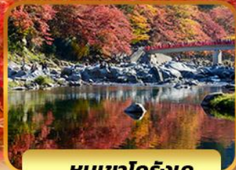
หุบเขาโคริงเค