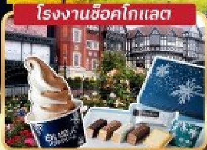
โรงงานช็อคโกแลต