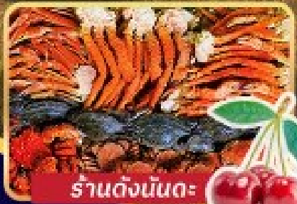
ร้านดังนินดะ