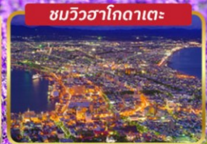
ชมวิวยามค่ำคืน