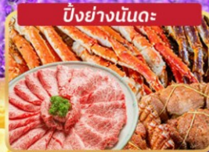
ปิ้งย่างมันตะ