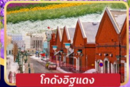
โกดังอิฐแดง