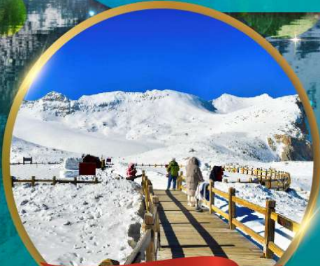
ต่ากู่กลาเซียร์