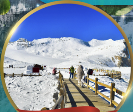
ต้าตุ่กลาเซียร์