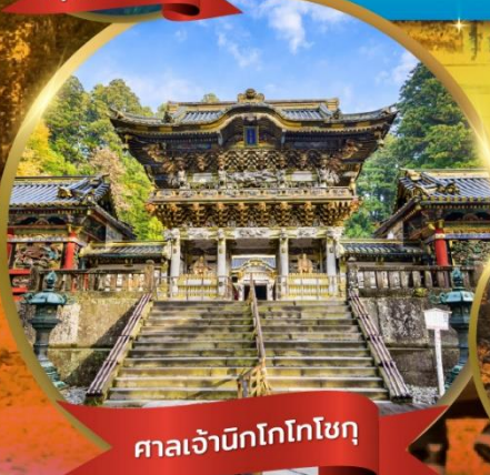
ศาลเจ้านิกโกโทโกโช