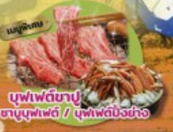
บุฟเฟ่ต์ซาซิมิ / บุฟเฟ่ต์บั้งย่าง