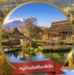
หมู่บ้านโธฮิเมะฮักโก

ศาลเจ้านิกโกโทโทกุ • น้ำตกเคกอน • ทะเลสาบชูเซ็นจิ • พักกินบุฟเฟ่ต์ออนเซ็น ชมเทศกาลแปะก๊วยเหลืองอร่ามเต็มท้องถนน • หมู่บ้านโธฮิเมะฮักโก • กั้นดั้น เมืองเก่าคาวาโกเอะ • ตลาดปลาซึกิชิ • วัดอาซากุสะ • ชิมบั้งอินจุกุ