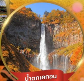
น้ำตกเคกอน