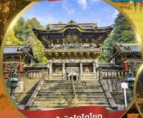
ศาลเจ้านิกโกโทโทกุ