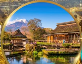
หมู่บ้านโอชิโนะฮักโก