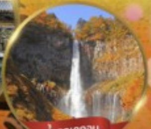
น้ำตกเคกอน