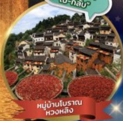
หมู่บ้านโบราณ หวงหลิง