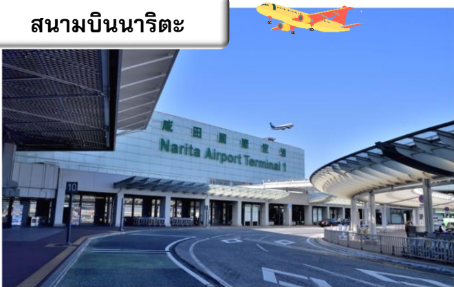
สนามบินนาริตะ

22.40 น. ออกเดินทางสู่ สนามบินนาริตะ ประเทศญี่ปุ่น โดย สายการบินไทย เที่ยวบินที่ TG 640