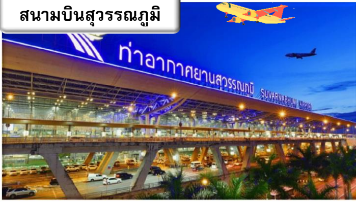
สนามบินสุวรรณภูมิ

เวลา 19.30 น. พร้อมกันที่ ท่าอากาศยานสุวรรณภูมิ อาคาร ผู้โดยสารขาออกระหว่างประเทศ เคาน์เตอร์ สายการบินไทย เจ้าหน้าที่คอยให้การต้อนรับ ดูแลด้านเอกสาร เช็คอิน และสัมภาระในการเดินทาง