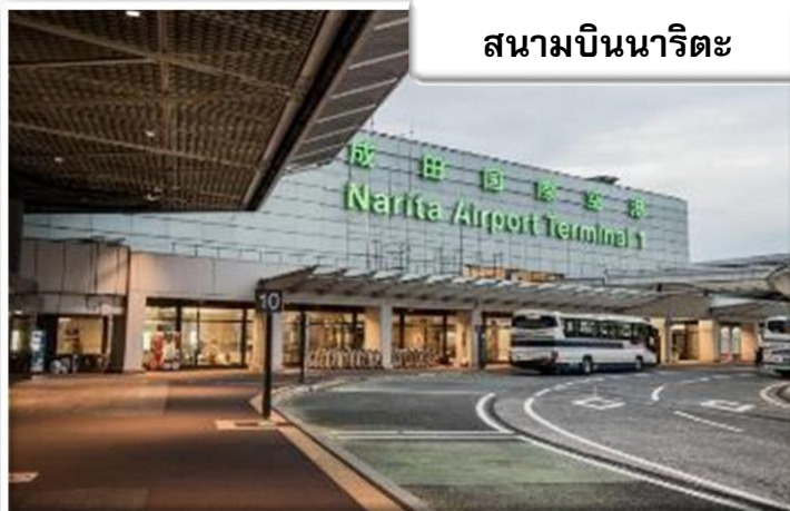
สนามบินนาริตะ

เวลา 02.30 น. ออกเดินทางสู่ สนามบินนาริตะ ประเทศญี่ปุ่น โดย สายการบินไทยแอร์เอเชียเอ็กซ์ เที่ยวบินที่ XJ 602