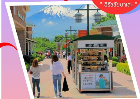
โทเทมบะ เอาก์เลท