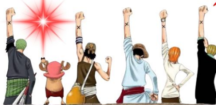
พิพิธภัณฑ์ฟูจิโอะ ฟูจิโกะ