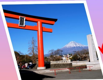
ศาลเจ้าฟูจิเซ็นเก็น