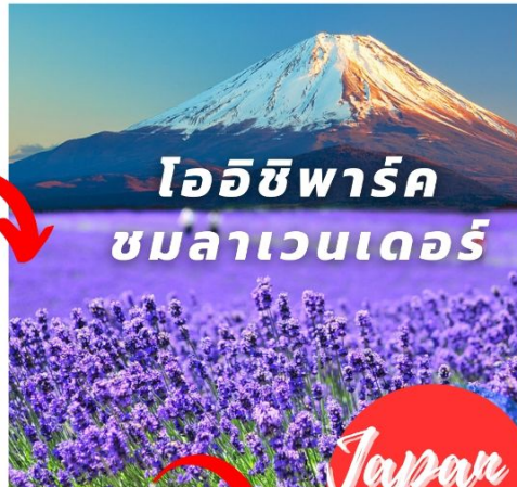
โออิชิพาร์ก ชมลาเวนเดอร์