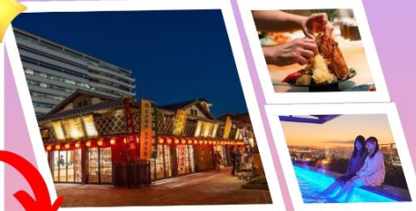
จุดเช็คอินใหม่ TOYOSU SENKYAKU BANRAI