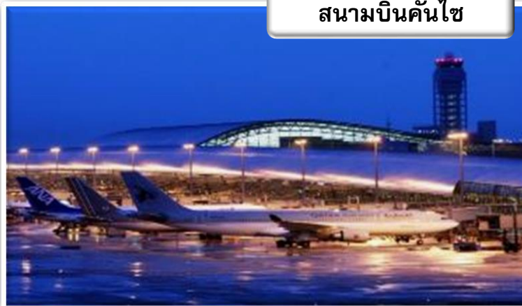
สนามบินคันไซ

เวลา 00.25 น. ออกเดินทางสู่ สนามบินคันไซ ประเทศญี่ปุ่น โดยสายการบินเจแปนแอร์ไลน์ เที่ยวบินที่ JL 728