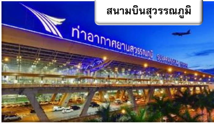
สนามบินสุวรรณภูมิ

เวลา 21.00 น. พร้อมกันที่ ท่าอากาศยานสุวรรณภูมิ อาคารผู้โดยสารขาออกระหว่างประเทศ เคาน์เตอร์สายการบินเจแปนแอร์ไลน์ เจ้าหน้าที่คอยให้การต้อนรับ ดูแลด้านเอกสาร เช็คอิน และสัมภาระในการเดินทาง