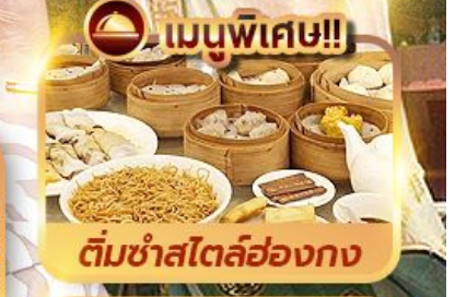
ติ่มซำสไตล์ฮ่องกง