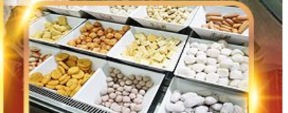
ชาบูบุฟเฟ่ต์