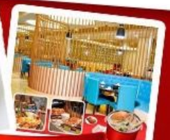
กึ่งแม่น้ำ + HOTPOT SEAFOOD