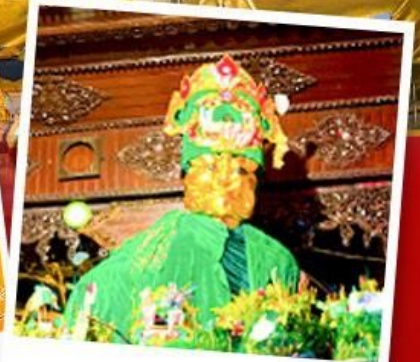
ขอพรมแม่ยักย์