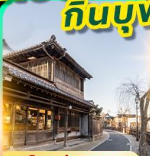
เมืองเก่าซาวาระ