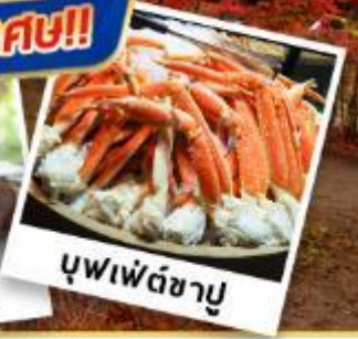
บุฟเฟต์ชาบู

เดินทาง 29 ต.ค. - 3 พ.ย. 67 06 - 11 พ.ย. 67 13 - 18 พ.ย. 67