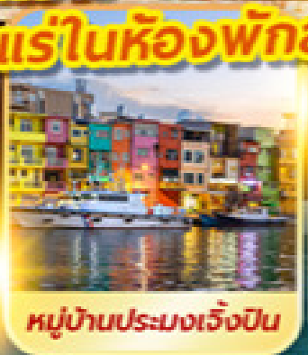
หมู่บ้านประมงเจี๋ยปิ่น