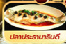
ปลาประรากริบดี