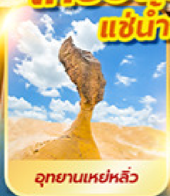
อุทยานเหย่หลิว

เที่ยวเต็ม!! ไม่มีวันอิสระ แช่น้ำแร่ในห้องพักส่วนตัว