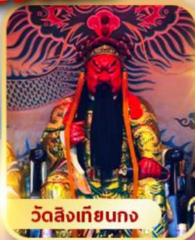
วัดสิงเกียนกง