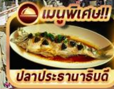
เมนูพิเศษ!! ปลาประธาราธิบดี