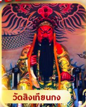
วัดลิ่งเกียนกง