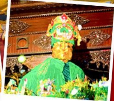
ขอพรมแม่ยักย์