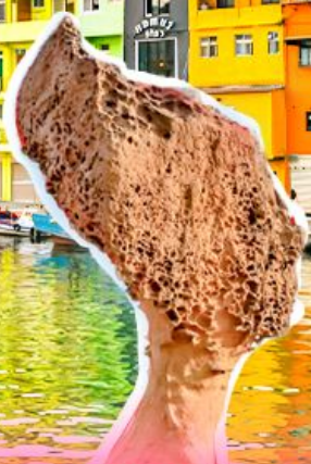
อุทยานเหย์หลิว