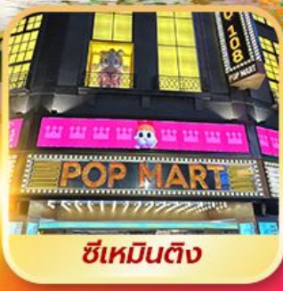
ซีเหมินติง