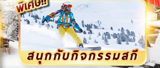
สนุกกับกิจกรรมสกี