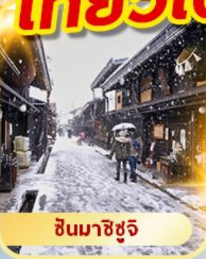
ชินมาชิซูจิ