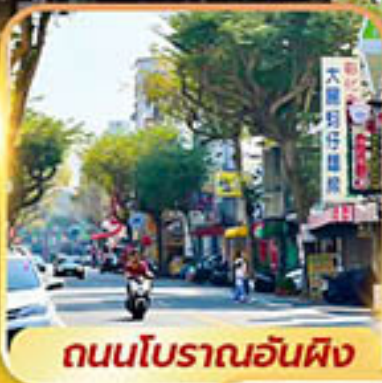
ถนนโบราณอันผิง