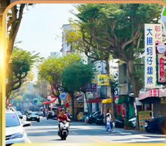
ถนนโบราณอันผิง