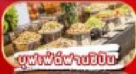
บุฟเฟ่ต์ฟานชีปัน