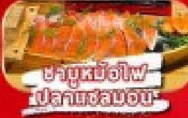
ซาบูทงโฮไฟ ปลาหมึกย่าง