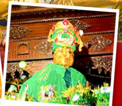
ขอพรแม่ย่ากษัตริย์