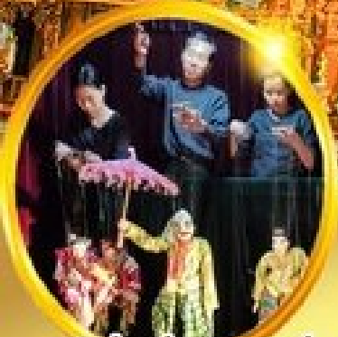
ชมโชว์เชิดหุ่นกระบอกพม่า

ย่างกุ้ง ทงสาวดี พระธาตุนครอินทร์แขวน พุกาม มัททันทะเลย์ 5 วัน 4 คืน