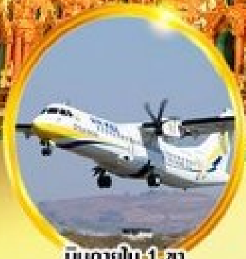
บินภายใน 1 ชม