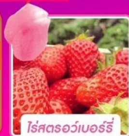
โรสตรอว์เบอร์รี่