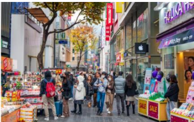
ทางเดินอย่างสวยงาม

ย่านเมียงดง เป็นย่านช้อปปิ้งที่คึกคักอันดับต้นๆ ใจกลางกรุงโซล บริเวณถนนเรียงรายด้วยอาคารร้านค้ามากมายหลายแบรนด์ไม่ว่าจะเป็นเสื้อผ้า กระเป๋า รองเท้า เครื่องสำอาง คาเฟ่ และร้านอาหารหลากหลายประเภท อีกทั้งยังมีแผงสตรีทฟู้ดเกาหลีต่างๆ ให้ได้ลองลิ้มชิมรส ย่านนี้จึงเป็นสถานที่ยอดนิยมของนักท่องเที่ยวและเป็นถนนช้อปปิ้งที่มีชีวิตชีวาเป็นอย่างมาก