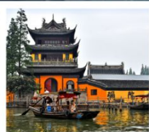
หมู่บ้านโบราณจูเจียเจียว

สวนสนุกยูนิเวอร์แซลปักกิ่ง / สวนสนุกเซี่ยงไฮ้ดิสนีย์แลนด์ / หมู่บ้านโบราณจูเจียเจียว ขึ้นหอไข่มุก / ลอดอุโมงค์เลเซอร์ / หาดไว่ทาน / จัตุรัสเทียนอันเหมิน พระราชวังโบราณกู้กง / กำแพงเมืองจีนด่านจี้หยงกวน สนามกีฬาโอลิมปิกปักกิ่ง / ถนนโบราณเจียนเหมิน