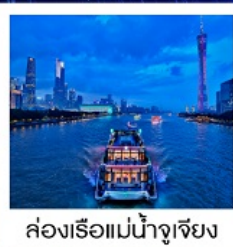
ล่องเรือแม่น้ำจูเจียง

ล่องเรือแม่น้ำจูเจียง / ช้อปปิ้งถนนปักกิ่ง / ช้อปปิ้งถนนซิงเซี่ยจิว / วัดโหลหนตัน / ศาลเจ้าตระกูลเฉิน / ถนนคนเดินหย่งซิงฟาง