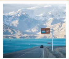
ทะเลสาบไ่ซาหุ