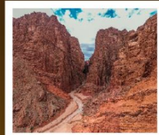
แกรนด์แคนยอนเทียนชาน