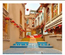
เมืองโบราณคิซาร์