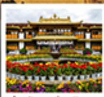
ตำหนักนอร์บูหลินบา

ชมวิวยอดเขาหนานเจียปาหว่า / จุดชมวิวกะเลป่าหู่หลาง / อุทยานเขามินยี / ระเบียบทรงจก / วัดลามะ พระราชวังโปตาลา / วัดโจคัง / ถนนเปดหลี่ยม / ทะเลสาบน้ำมูเซวู / ตำหนักนอร์บูหลินบา / เมืองโบราณสั่วไต้