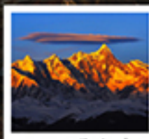
พระราชวังโปตาลา