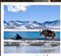
ทะเลสาบน้ำมูเซวู