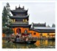
หมู่บ้านโบราณจูเจียเจียว

สวนสนุกยูนิเวอร์แซลปักกิ่ง / สวนสนุกเซี่ยงไฮ้ดิสนีย์แลนด์ / หมู่บ้านโบราณจูเจียเจียว ซินห่อไข่มุก / ลอดอุโมงค์ทะเลฮอร์ / หาดไว่ทาม / จิตรกรรมอันฮินเหมิน พระราชวังโบราณคู้กง / กำแพงเมืองจีนด้านจหยงทวน สนามกีฬาโอลิมปิกปักกิ่ง / ถนนโบราณเฉียนเหมิน