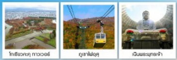
ไทริยวทงู ทาวเวอร์ | ภูเขาไฟอุสุ | เป็นพระพุทธรูป

หุบเขานรกจิโตะคุดาบ / โถงถ้ำฮิโระงะคาเนโมริ ตลาดเช้าเมืองฮาโกดาเตะ / ไทริยวทงู ทาวเวอร์ ภูเขาไฟอุสุ / จุดชมวิวยุซึกิ / ค่องเรือชมทะเลสาบโทบะ สวนอุสึกิโตะ / สวนพฤกษศาสตร์ / เก็บผลไม้ / สัมผัสน้ำพุร้อน พิพิธภัณฑสถานแห่งชาติ / อนุสาวรีย์น้ำโบราณ / โรงปั้นแก้วคิตาอิชิ เป็นพระพุทธรูป / ถนนช้อปปิ้งทาบูทสึจิ / ย่านฮูซุกิโนะ