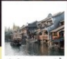
เมืองโบราณผานหลงกู่เจิน